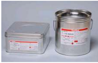
弾性エポキシ樹脂 ロンジーパテ F-198